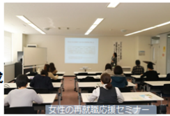
女性の再就職応援セミナー