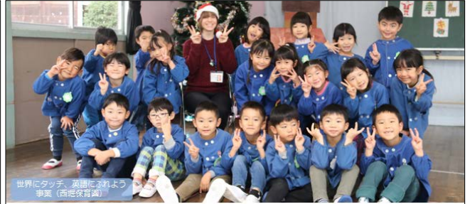
世界にタッチ、英語にふれよう 事業（西郷保育園）