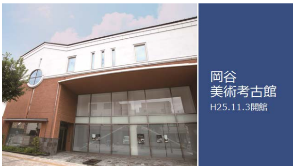
岡谷 美術考古館 H25.11.3開館

本日は平成21年~30年度第4次岡谷市総合計画期間が3月で終了いたします。この期間全力を注いでまいりました、6つの重要施策の現在の状況と今後のあり方について報告させていただきます。