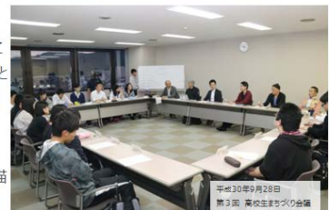
平成30年9月28日 第3回 岡谷市まちづくり会議

市民誰もが安全で安心して、健康で生きがいを持って暮らすことができ、このまちに住み、働くことに誇りと自信、そして愛着をもてるまち。 将来にわたって持続可能で、将来のまちに多くの夢と希望を描ける確かなまちづくり。