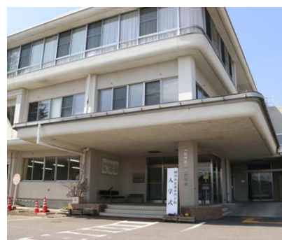
岡谷市看護 専門学校 H26.4.1開校

・文化芸術の発信拠点であると同時に、まちなかの交流拠点としての役割を果たしてまいります。