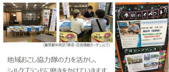
(東京都中央区「移住・交流情報カーテン」にて)