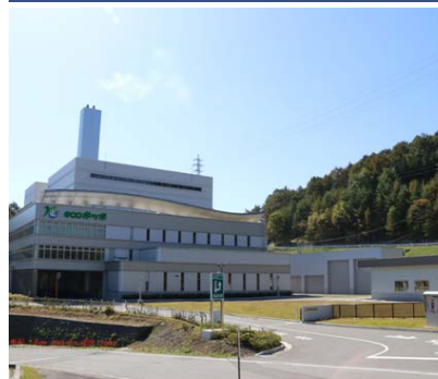
諏訪湖周 クリーンセンター H28.12.1本格稼働