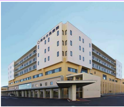
岡谷市民病院 H27.10.11開院