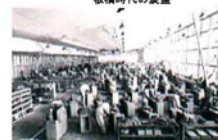
岡谷市移転当時の工場内