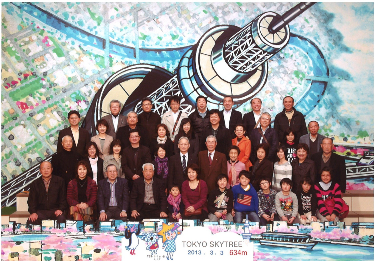
親睦バスハイク「東京スカイツリー」 3月3日