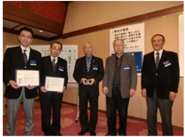
ホール・ハリス・フェロー